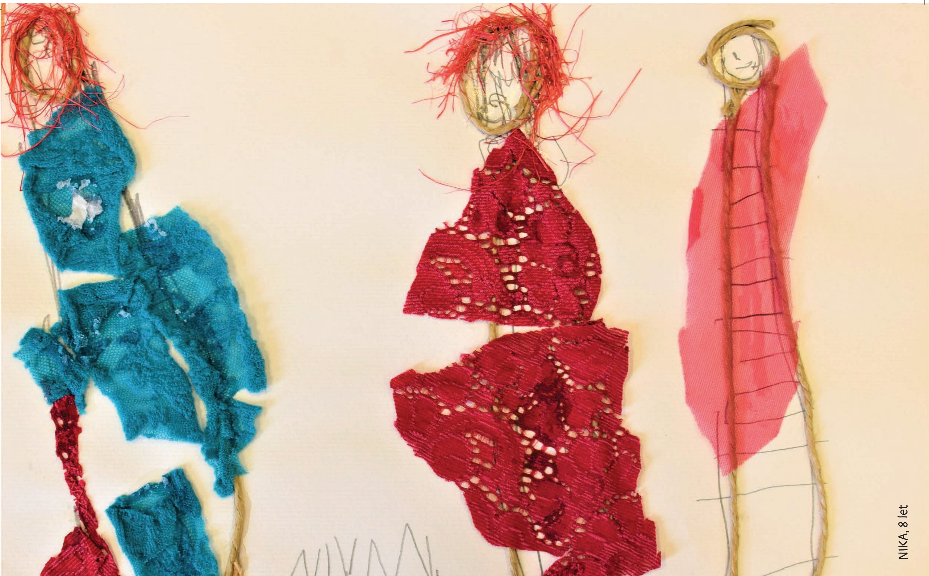
NIKA, 8 let